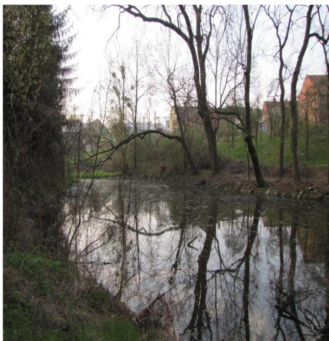
Rasovna - Čertoryje