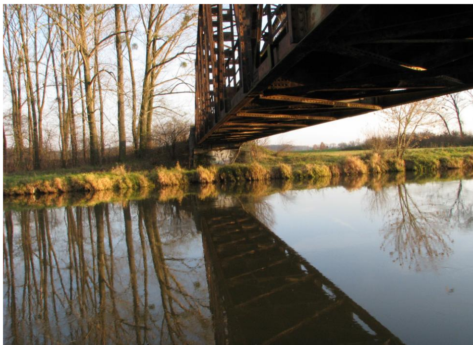
Charvatský most přes řeku Moravu