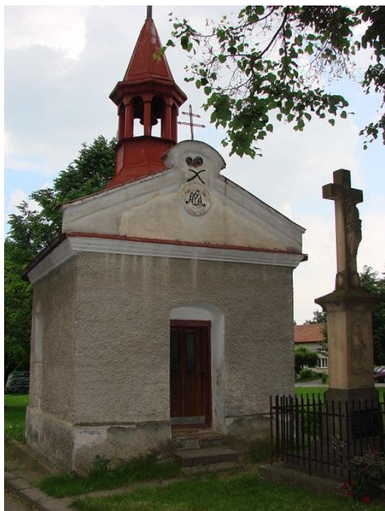
Kaple Panny Marie – Drahlov